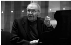
Kurtág György (1926-)

Sajátos stílusú gyermekkönyvek írója, melyekben éleslátóan, de kedvesen ír a gyermek-felnőtt kapcsolatáról. Évtizedeken át volt a Móra Könyvkiadó főszerkesztője, egy ideig a Minervának szerkesztője is. Elnökségi tagja volt az UNICEF magyar bizottságának, és a Gyermekkönyvek Nemzetközi Tanácsa magyar bizottságának.