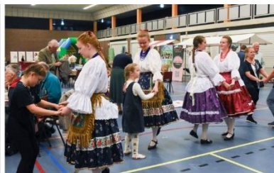
Néptáncelőadás és -oktatás