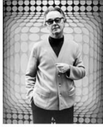
Victor Vasarely (1906-1997)

Világhírű festő, szobrász, az op-art művészeti irányzat megalapítója. 1920-as évektől grafikát és festészetet tanul. Tanárai közt van Bortnyik Sándor. 1930-ban Párizsba költözik. 1950-ben indult el optikai és kinetikai vizsgálatainak útján. Fontos volt együttműködése Kassák Lajossal. Több múzeuma is van: Pécsset, Budapesten (Óbudán) és Aix-en-Provence-ban.