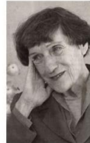
Janikovszky Éva (1926-2003)

Festő, grafikus, látványtervező, porcelánfestő, könyvillusztrátor. Mesterei többek közt Szőnyi István és Bernáth Aurél. Látványtervezője az Egri Csillagokból készült filmek. Szürrealisztikus elemekkel ötvözött klasszikus festői stílus jellemezte, a szimbolizmus is hatott rá. A hollóházi porcelánmanufaktúrában számos motívumot jegyez. Életműkiállítása Várdán látható. Munkácsi Mihály-díjat kapott és a Magyar Érdemrend parancsnoki keresztjével díjazták.