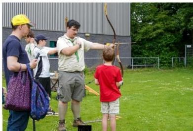
70. Attila Cserkészcsapat íjászfoglalkozása