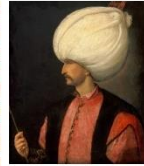
I. Szulejmán szultán (Tiziano műhelyéből)