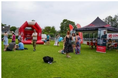
Játék a szabadban