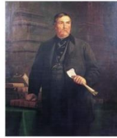
Deák Ferenc (1803-1876)

Magyar főnemes, birodalmi herceg, az 1703-ban kitört Rákóczi-szabadságharc vezetője. 1704-től erdélyi fejedelem. A Habsburg-ellenes küzdelmet 1711-ig folytatta, utána külföldre kényszerült. 1717-1735 között Törökországban. Emlékiratai 1739-ben Hágában jelentek meg francia nyelven. Földi maradványait 1906-ban ünnepélyesen újratemették a kassai domban.