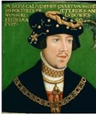
II. Lajos magyar és cseh király (Hans Krell festménye)

A Jagelló-ház kihalása után az ország két pártra szakadt: az egyik Habsburg Ferdinándot, a másik Szapolyai Jánost választotta magyar királynak. Ebben a helyzetben a törökök 1541-ben megszállták Budát és az ország középső részét 150 éven át megszállva tartották. Ezzel a középkori magyar királyság megszűnt addig ismert formájában.