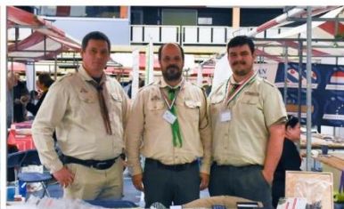
A 70. Attila Cserkészcsapat képviselői