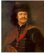
II. Rákóczi Ferenc (1676-1735)

Magyar főnemes, birodalmi herceg, az 1703-ban kitört Rákóczi-szabadságharc vezetője. 1704-től erdélyi fejedelem. A Habsburg-ellenes küzdelmet 1711-ig folytatta, utána külföldre kényszerült. 1717-1735 között Törökországban. Emlékiratai 1739-ben Hágában jelentek meg francia nyelven. Földi maradványait 1906-ban ünnepélyesen újratemették a kassai domban.