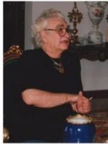
Szász Endre (1926-2003)

Író, forgatókönyvíró. Irodalmi művei először 1955-ben jelentek meg. Nagy ismertséget főleg Jancsó Miklós-filmjeinek forgatókönyvével szerzte 1964-től kezdődően. Dramaturgként is dolgozott, többek közt a Népszínháznál és a kecskeméti Katona József Színháznál. Számos díjat kapott: József Attila-díj, Kossuth-díj és a Magyar Köztársasági Érdemrend középkeresztje.