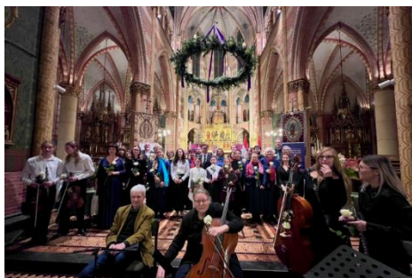
A Hágai Magyar Kórus