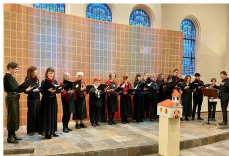
Az Amszterdami Magyar Kórus