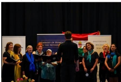
Hágai Magyar Kórus