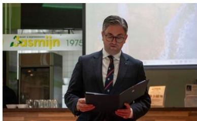
Horogszei Szilágyi-Landek Dániel, Magyarország hágai nagykövete köszöntőbeszédet mond