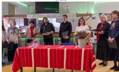
A Hágai Magyar Kórus előadása