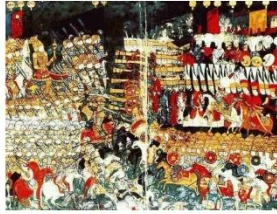
A mohácsi csata (török miniatúra)